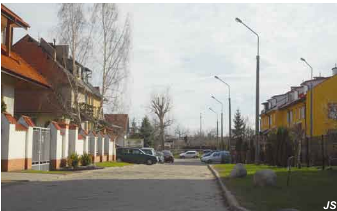
Ul. 3 Maja