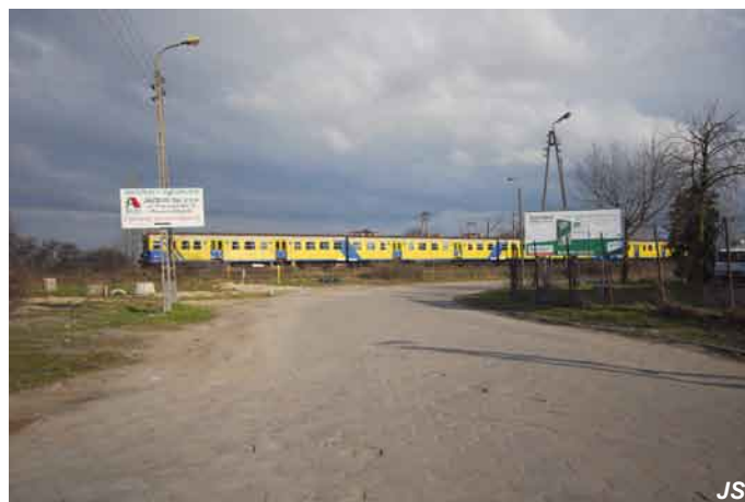
Miejsce pod zaprojektowany wiadukt