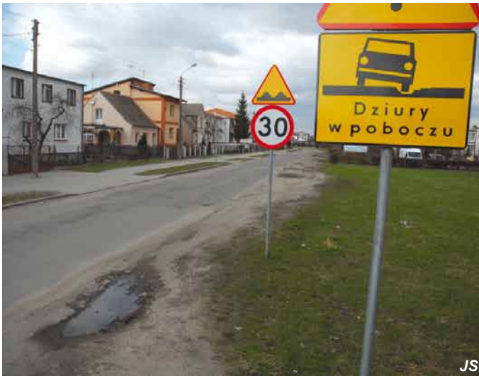
Ul. E. Plater