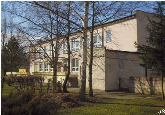
Przedszkole przy ul. Niepodległości