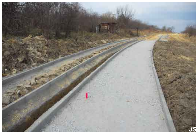
Trakt pieszo-rowerowy wzdłuż Kanalu Raduni